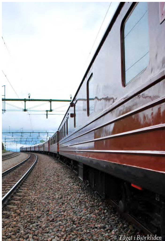
Tåget i Björkliden

Vi lämnar Björkliden ca kl 12.00 och åter lunch på tåget som tar oss söderut.