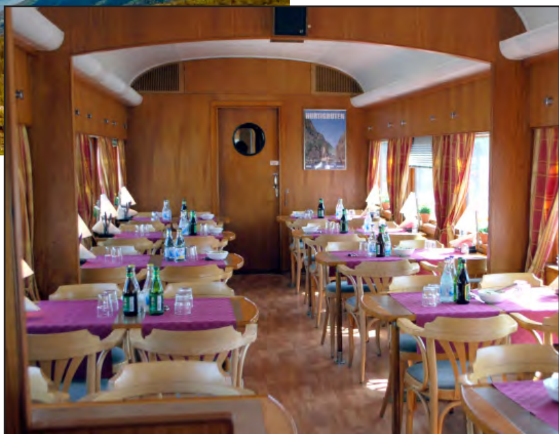
Interiör från restaurangvagnen

För din bekvämlighet ingår det mesta. Som alltid har vi sparat det bästa till sist, nämligen vårt paketpris för detta researrangemang. Detta pris kan vi hålla endast tack vare våra ideella arbetsinsatser.